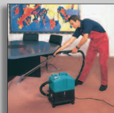
Maquina en acción