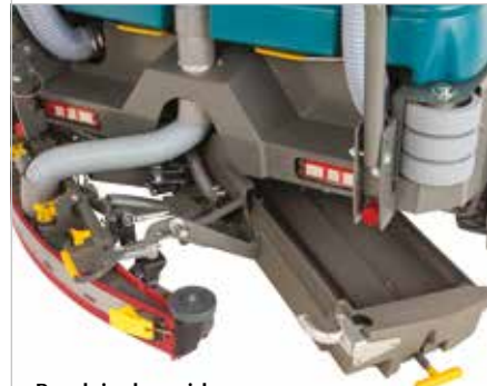
Bandeja de residuos