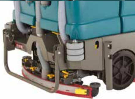
Bayeta parabólica Dura-Track™