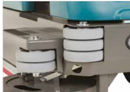
Chasis para tareas pesadas y rodillos de esquina acolchados

Tejadillo de protección que previene que el operario sea golpeado por objetos que salgan despedidos.