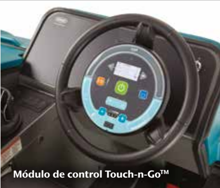
Módulo de control Touch-n-Go™