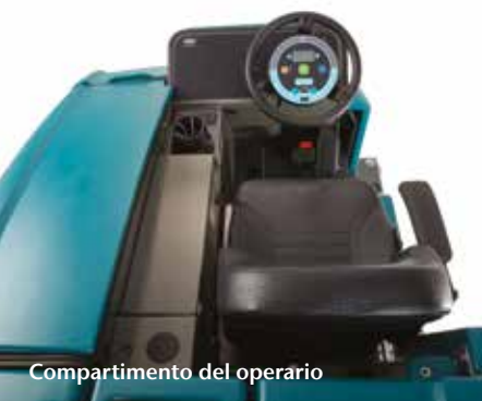
Compartimento del operario