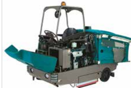
Diseño de fácil acceso